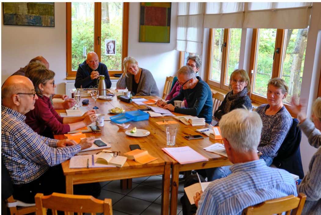
Cicero "Gespräche in Tusculum" Seminar auf Hiddensee Oktober 2023