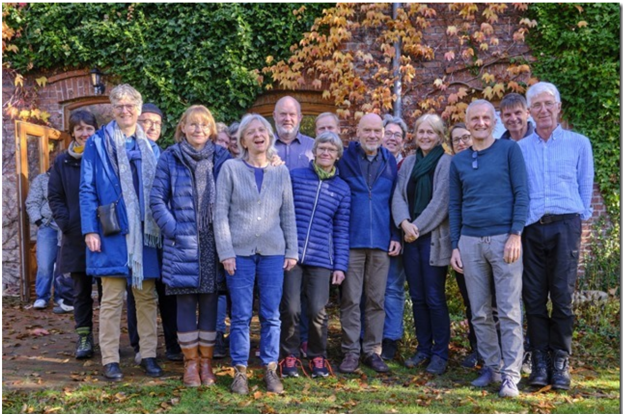
Die Seminargruppe in Kloster auf Hiddensee Oktober 2023